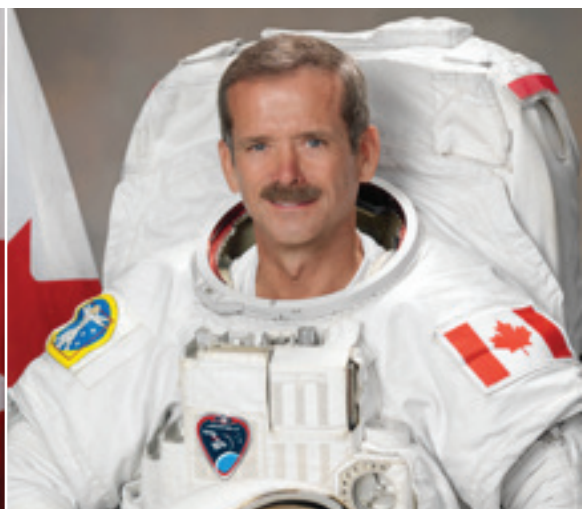
13738 Chris Hadfield CMR 1982