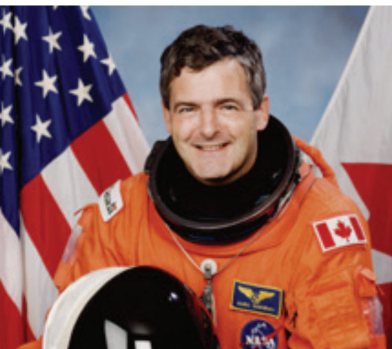
8276 Marc Garneau CMR 1970

De nombreux autres diplômés du CMR se sont distingués en tant que membres du Parlement canadien, ministres du cabinet, dirigeants municipaux, pour leur service au sein des Nations Unies, à titre de boursiers Rhodes, d'astronautes, de professionnels de la santé et du droit et à d'autres titres au Canada et à l'étranger.